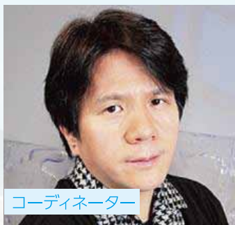
コーディネーター